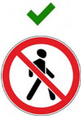
Движение пешехода запрещено